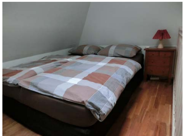
Traumlandschaft mit Oberlicht